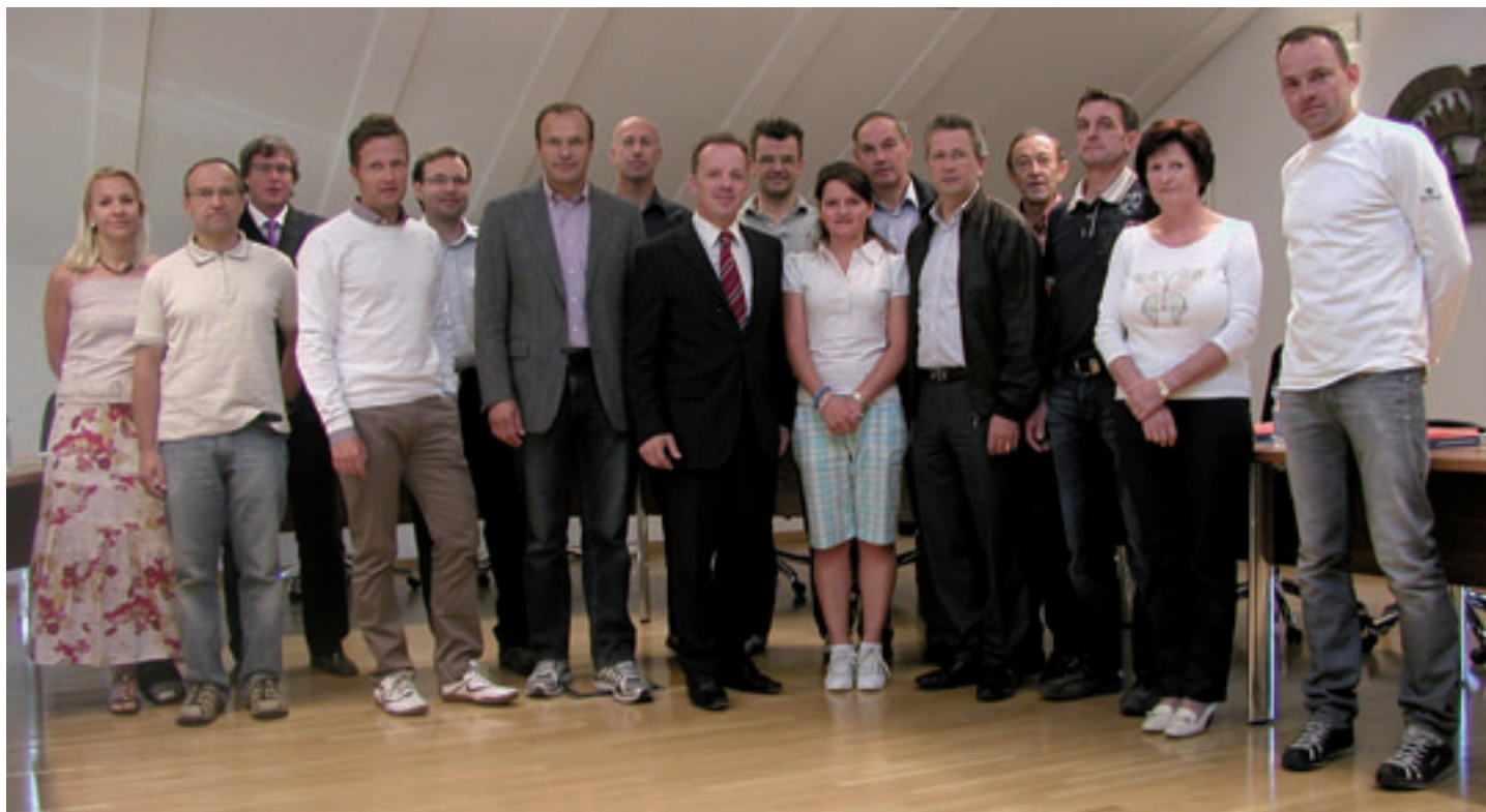
I cunselieres de chemun te sala de cunsëi