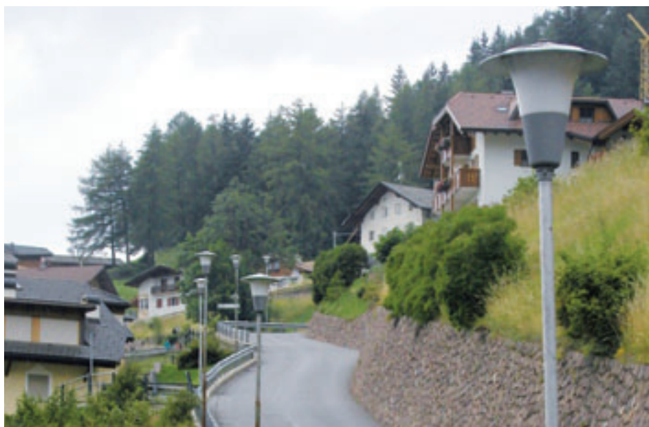
La lumes de streda sun Plesdinaz unirà baratedes ora. Tres la lums a LED nuevas fejen cont de sparanië l 70% dl strom