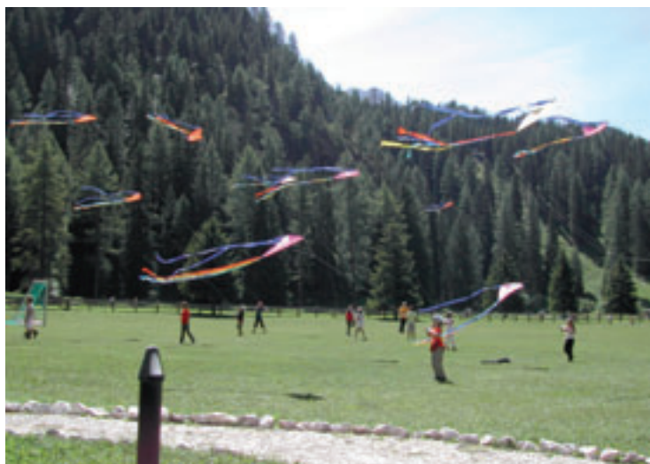
L Pavël ie na garanzia per n instà nia da stufé

Coche bele tradizion, vëniel stlut jù l'instà dl "Pavël" cun na gran festa per duc i mutons, adum cun la cumpaniadëu-