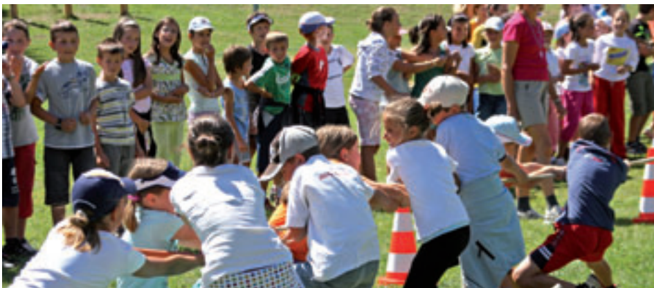
I ministronc à fat festa sun Pana

Nsci se à n sada ai 31 de lugio i ministronc de S. Cristina y Sëlva abinà sun Pana per na blòta festa. Deberieda cun i pluans y la companiadëures ài pudù passé n bel domesdì fajan juesc de unì sort y mo na bela grilieda.