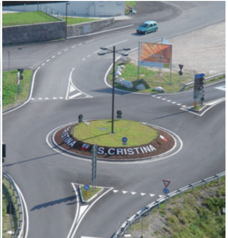
Die Dorfeinfahrten wurden neu gestaltet.