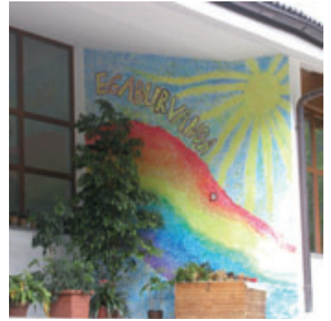
Der Kindergartenbesuch ist ab dem 3. Kind kostenlos.

Mit dieser Maßnahme setzt unsere Gemeinde einen weiteren wichtigen Akzent in der Familienpolitik.